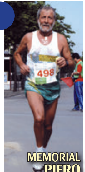
MEMORIAL PIERO BUCHIGNANI